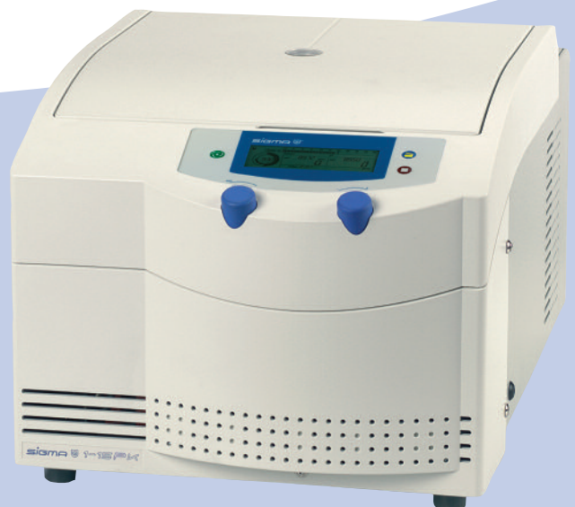
Tischkühlzentrifuge Refrigerated Centrifuge